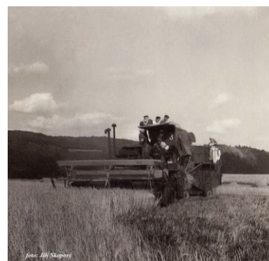
První kombajn ve Tmani na poli Na Lázu v roce 1953