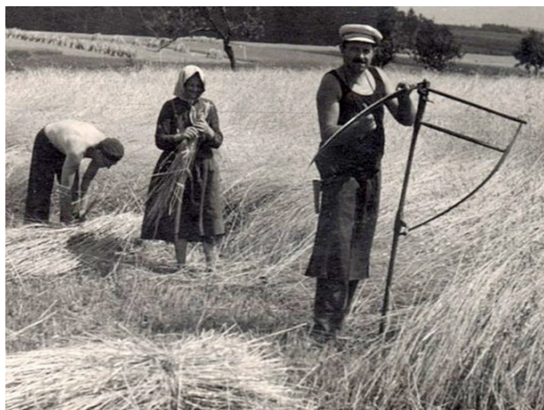
Sekáč s vazačkou snopů