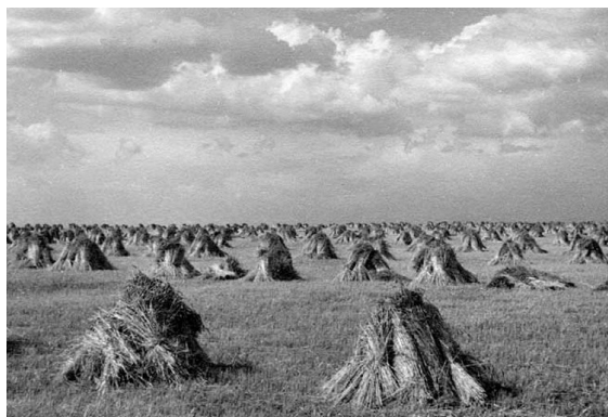
Pole plné panáků

V některých případech se mlátilo i přímo na poli.