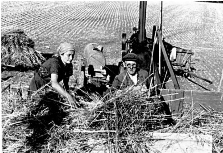
Mláčení na poli

Pytel vymláceného obilí musel vážit 70 kg, vážilo se na decimálce hned vedle mlátičky a pokud bylo obilí jakž takž vyschlé (mohlo mít maximálně 15% vlhkosti), nakládalo se pomocí rudlíků na valníky a odváželo do výkupního družstva v Berouně. Pokud bylo třeba dosušit, sušilo se nejen v budově sladovny, ale také ve špejcharu horního dvoru.