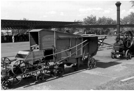
Mlátička s parním strojem