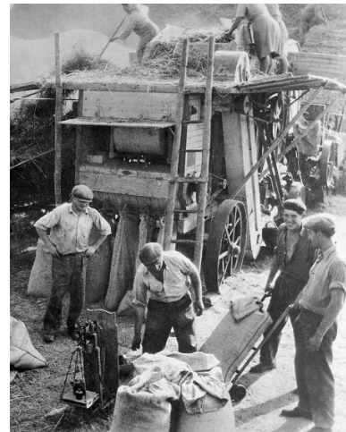
Vážení pytlů s obilím

Výmlat pomocí cepů se v té době používal v mini měřtku i nadále – víceméně už ale pouze pro soukromé účely. Naše babičky chodily s nůšemi na zádech na posečená a sklizená obilní pole paběrovat obilní stébla, která se nepodařilo posekat a která tak zůstala na poli. Říkávalo se tomu „chodit na klásky“. Paběrování patřilo ke žním a bylo tolerováno jak soukromými sedláky, tak později i zemědělskými družstvy. „Klásků“ nebývalo mnoho, ale někdy se jich podařilo při zapojení celé rodiny přinést přece jen větší množství, takže pak tvořily dobrou a levnou část krmení nejen pro slepice, které tenkrát byly v každém stavení, ale i pro další domácí drůbež a dobytek.