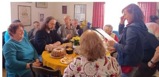
Shromáždění náboženské obce ČČSH Tmaň 30.03.2025