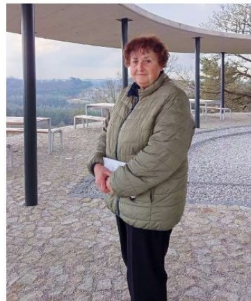
Čteme Bibli Koněpruské jesyně 25.03.2025