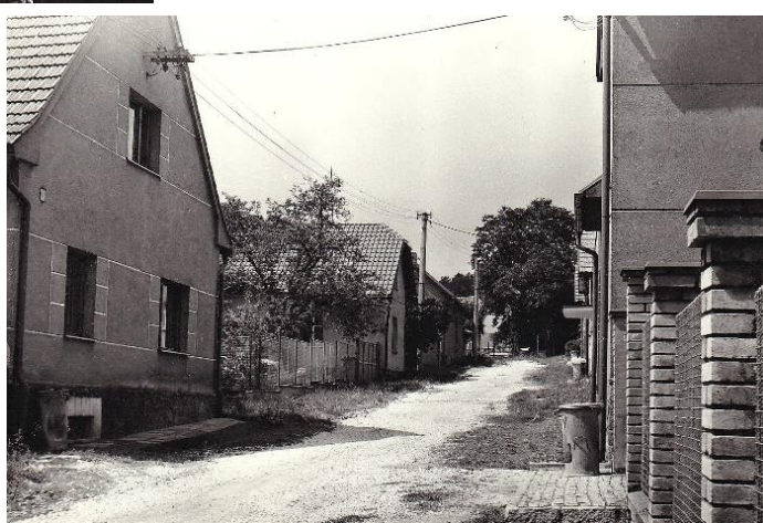
Takhle vypadala Revoluční ulice několik let před zahájením kanalizačních prací